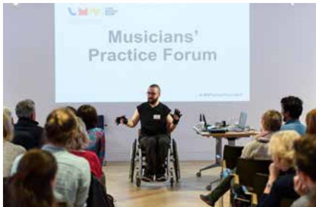
Fforwm Ymarfer Cerddorion

Lle yw Live Music Now sydd wedi bod bob amser yn rhywle lle gall cerddorion ddatblygu eu crefft a mireinio eu sgiliau. Byddwn yn parhau i ddatblygu fframweithiau hyfforddi sy'n ymatebol i anghenion ein cerddorion a'n cyfranogwyr. Fel asiantau diwylliannol eu hunain, byddwn yn gweithio'n nes gyda'n cerddorion i ddatblygu ein rhaglenni a hyrwyddo eu twf o fewn cymunedau fel conglfeini cydlyniad a chynhwysiant cymdeithasol.