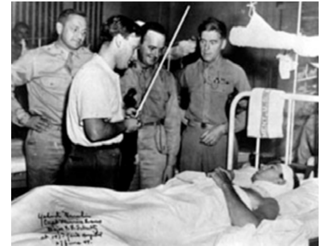
Yn ystod yr Ail Ryfel Byd, roedd Yehudi Menuhin yn chwarae i Luoedd y Cynghreiriaid oedd wedi brifo.